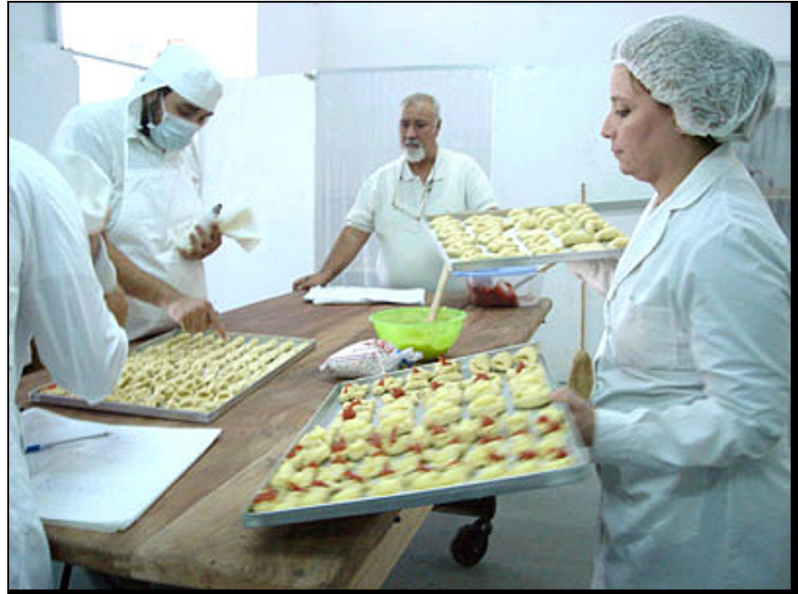
The bakers of the Federation of Land and Housing Concordia, working under standards INTI

Core Supply Program Community (ABC) of NRTIs proposed addressing the problem based on food technology transfer to popular sectors, and a model of community self-generating systems in which the local community produces and distributes food to a healthy diet, at an affordable price. In this way, based on the valuable pool of capital that are community-based organizations, ABC is promoting a new culture of meeting the basic consumption needs, from education, training and organization of efficient small-scale production .